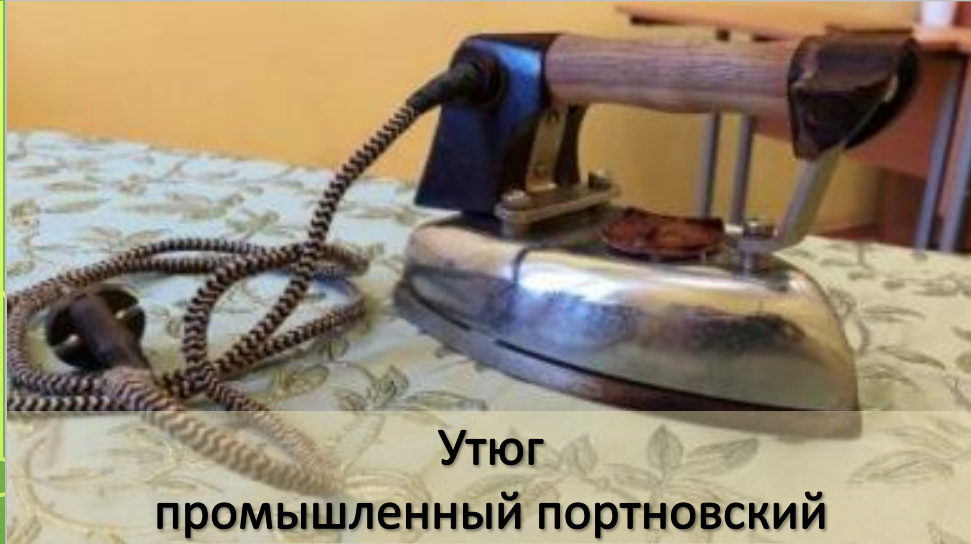
Утюг промышленный портновский