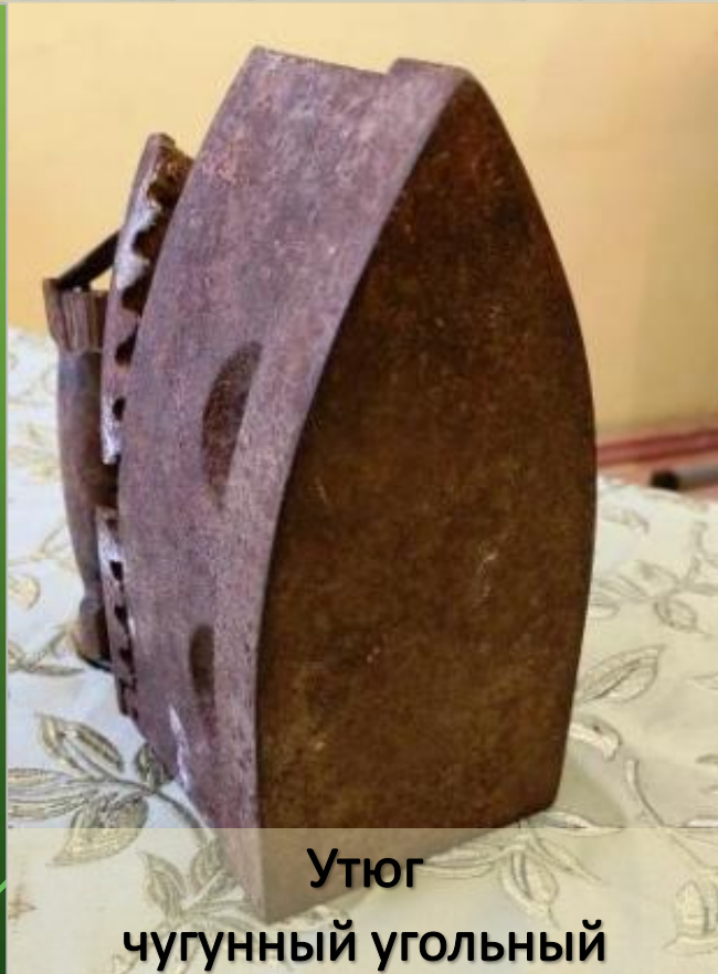
Утюг чугунный угольный